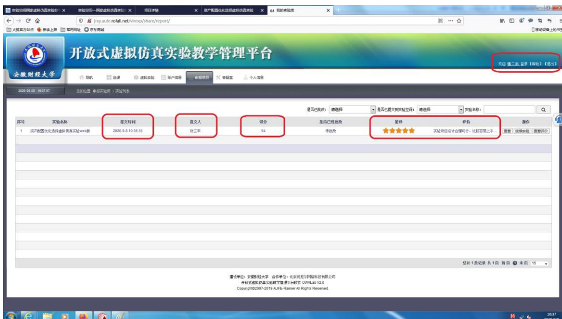
张三丰图 2（红字为参赛选手姓名）